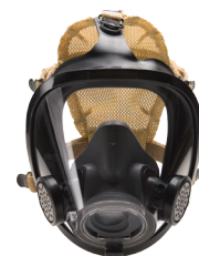
SureSeal System for AV-3000